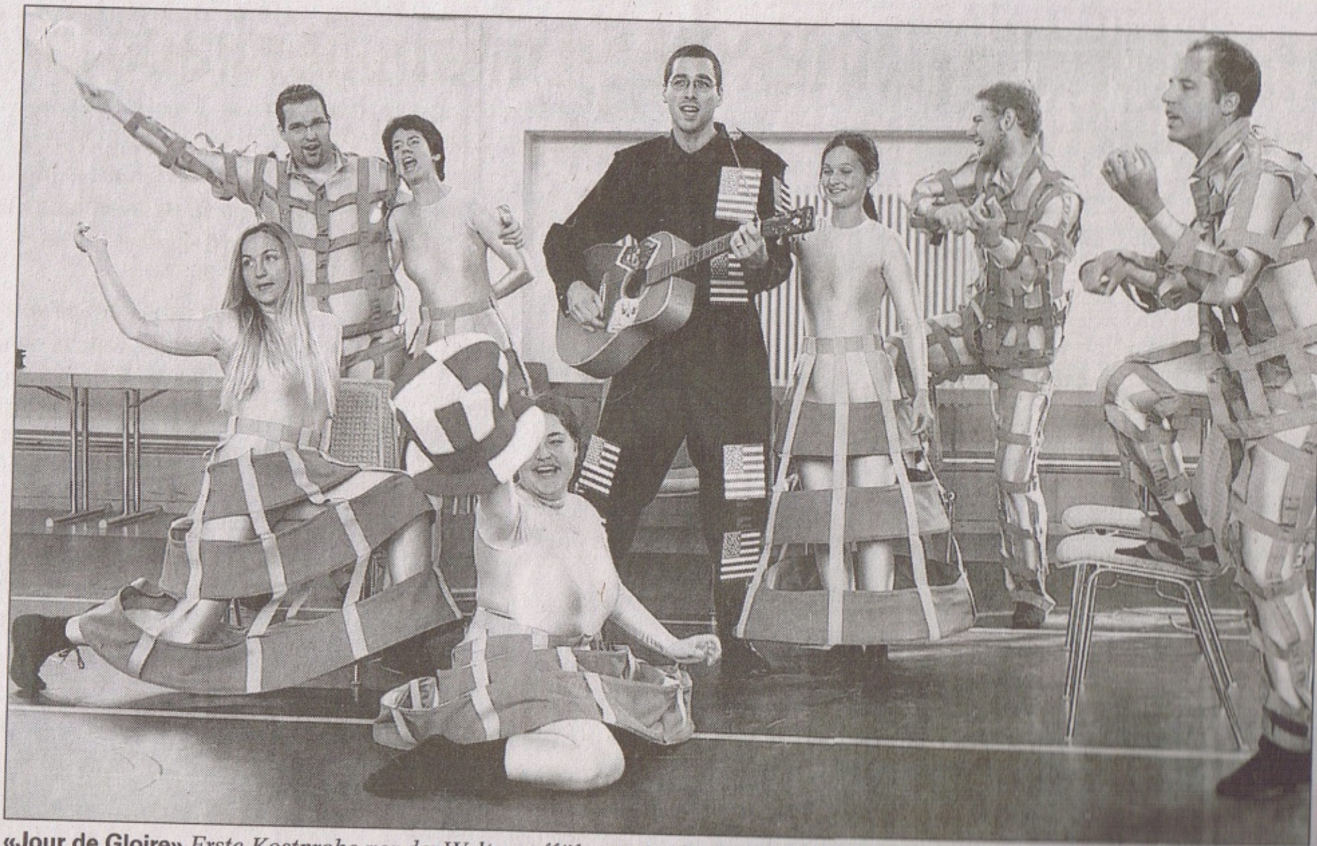
«Jour de Gloire» Erste Kostprobe vor der Welturaufführung in der Bärenmatte Suhr.

Und nun steht die Uraufführung vor der Tür. Mit grösster Intensität wird seit geraumer Zeit in der Bärenmatte in Suhr gearbeitet. Sorgfältig wird das Bühnenbild von Bert De Raeymaecker gebaut. Es basiert auf einem Modell